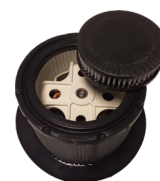
Filtre H14 Special salle blanche